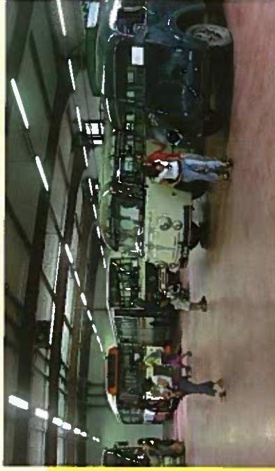
Une belle lignée ...