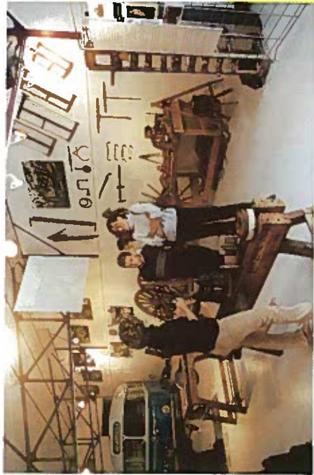
Un point fort : la visite guidée

(Visites spéciales pour les scolaires de tous niveaux : nous consulter).