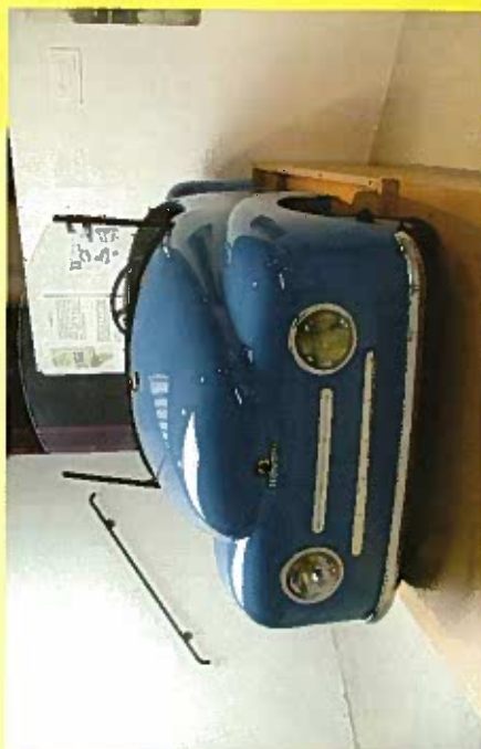
Petite « Coccinelle » sans permis