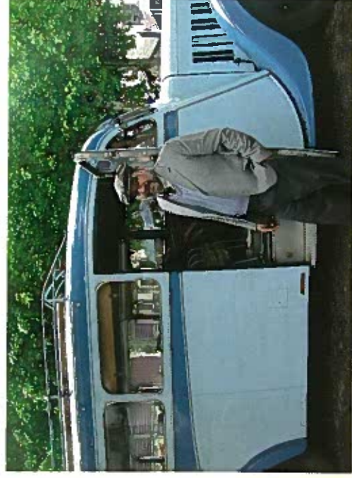
Le P32 ... une star de cinéma