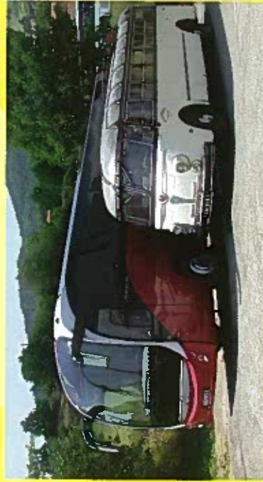
... Prélude à Magetlys