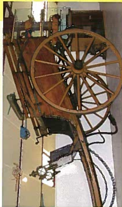
Jardinière de la Belle Epoque